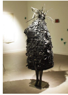
La bestia noire 2019 Costume rituel Assemblage d'objets plastiques