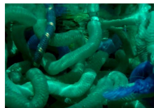
La bestia verte 2019 Vidéo 1'30'' Images - Thierry Salvert et Cécile Borne Son - Louise Dupont