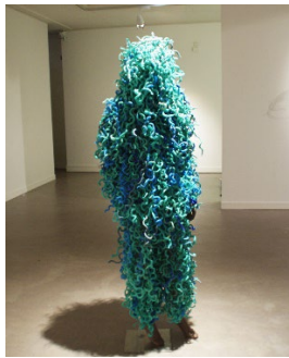
La bestia verte 2019 Costume rituel Assemblage de cordages plastiques