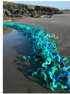
Paysages du Septième Continent 2019 Série photographique numérique