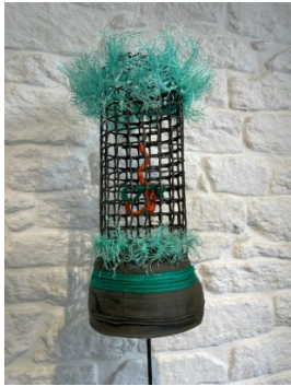
Chapeaux 2019 Cordages, cartouches, métal, ciment, tissu