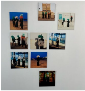
Homoplasticus 2023 Série photographique numérique imprimée sur dibon