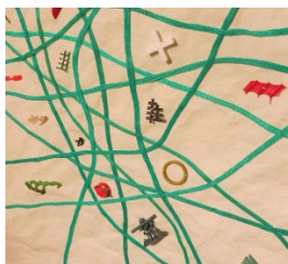
Agglomérations 2019 Plastiques cousus sur voile