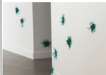
Organismes Invasifs 2019 Casier à crevettes, poches à huîtres et cordages